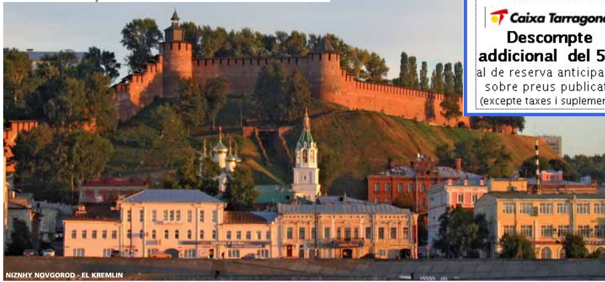
NIZHNY NOVGOROD - EL KREMLIN

Als CREUERS FLUVIALS del Rin i Mosela, Païssos Baixos, Danubi, Rússia, i Duero mantenim bonificació del 12% fins 60 dies en lloc dels 90, i 7% fins 40 dies en lloc de 60 abans de la sortida