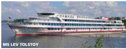
MS LEV TOLSTOY