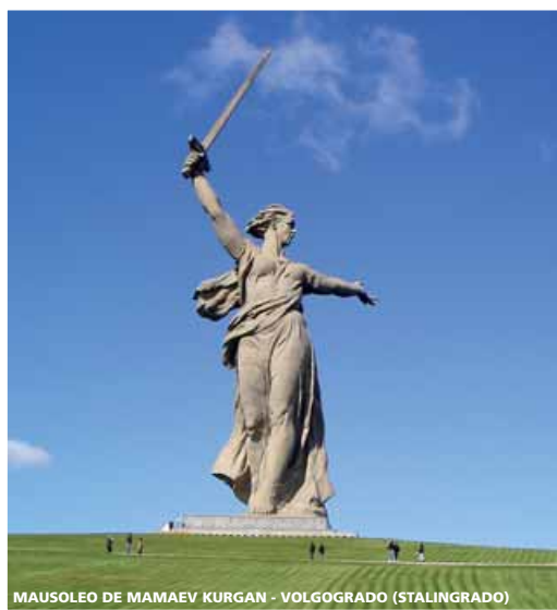
MAUSOLEO DE MAMAEV KURGAN - VOLGOGRADO (STALINGRADO)