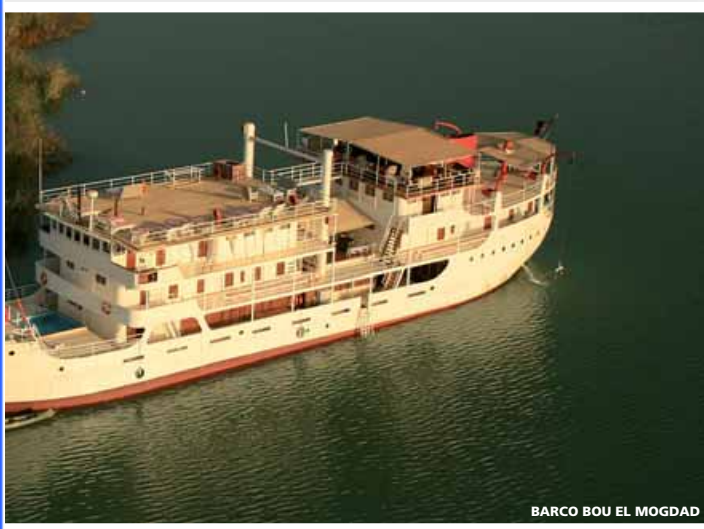
BARCO BOU EL MOGDAD