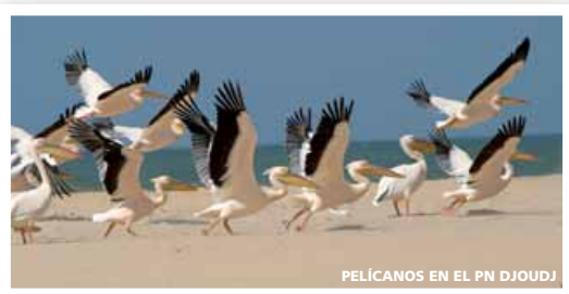
PELÍCANOS EN EL PN DJOUDJ

• Domingo • Pensión completa a bordo. Surcamos las aguas del río Senegal hasta llegar a la presa de Diama, esta curiosa obra de ingeniería regula la crecida de las aguas del río, permitiendo el cultivo e impidiendo las crecidas que durante siglos han azotado a los pobladores de ambas orillas. Continuamos la navegación hasta el Parque Nacional de Djoudj, tercer santuario ornitológico del mundo, declarado Reserva Mundial de la Biosfera por la UNESCO y donde podremos avistar multitud de aves en su migración hacia el sur: pelícanos, patos, flamencos, cormoranes, garzas, etc., asimismo podremos