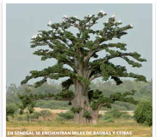
EN SENEGAL SE ENCUENTRAN MILES DE BAOBAS Y CEIBAS