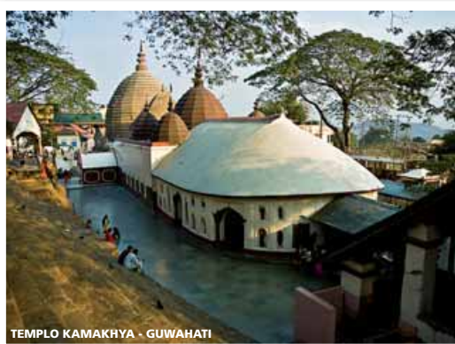
TEMPLO KAMAKHYA - GUWAHATI

• Domingo • Desayuno a bordo del barco. Llegada a Dibrugarh. Desembarcaremos.