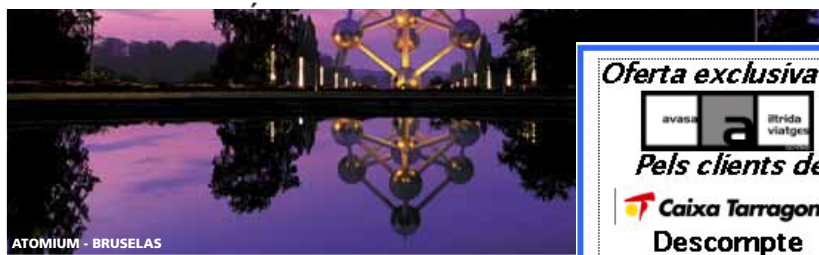
ATOMIUM - BRUSELAS

Als CREUERS FLUVIALS del Rhin i Mosela, Paissos Baixos, Danubi, Russia, i Duero mantenim bonificació del 12% fins 60 dies en lloc dels 90, i 7% fins 40 dies en lloc de 60 abans de la sortida