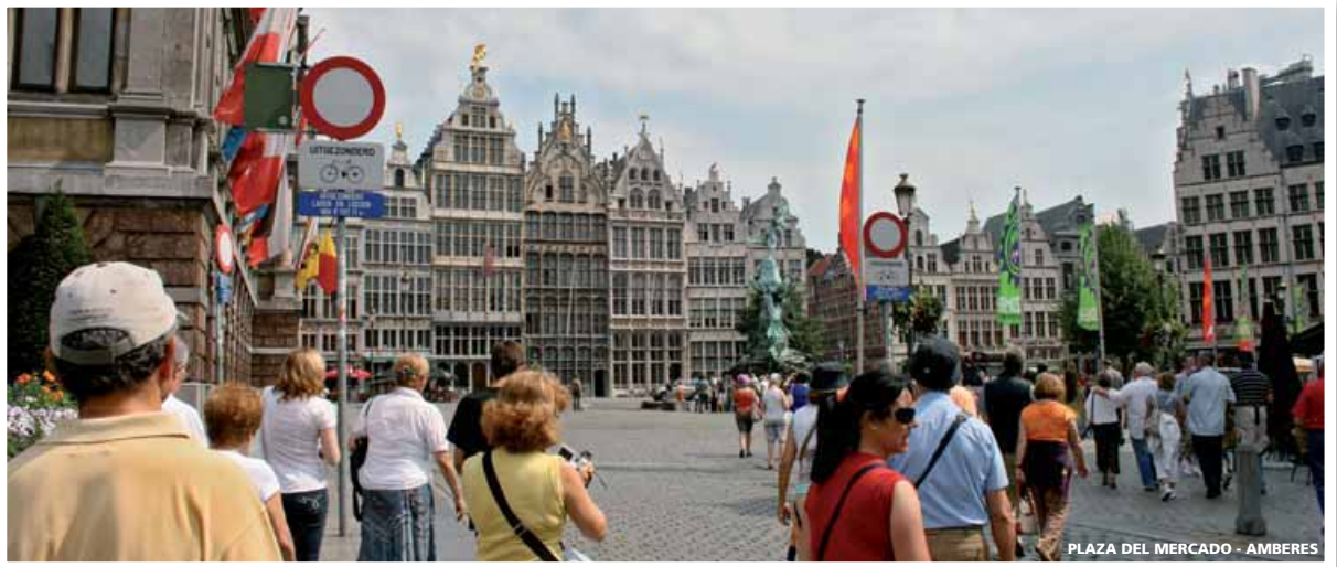
PLAZA DEL MERCADO - AMBERES

D Descuento (reservas anticipadas) 7% | 12% PLAZAS LIMITADAS